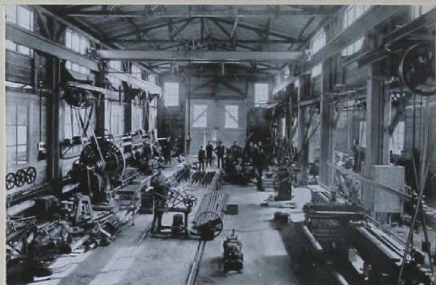
Værftets første maskinværksted