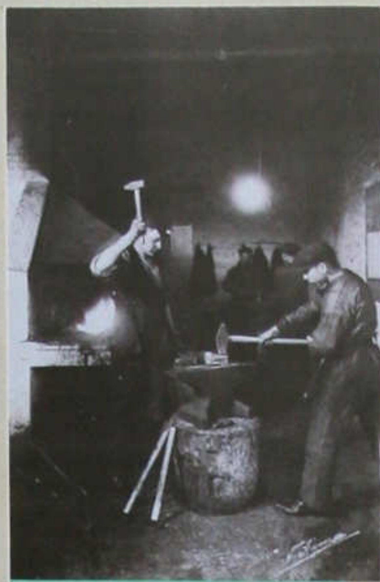
Interiør fra Danmarksgade 14-16 i 1905