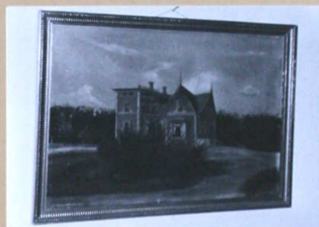
Maleri af Solbakken