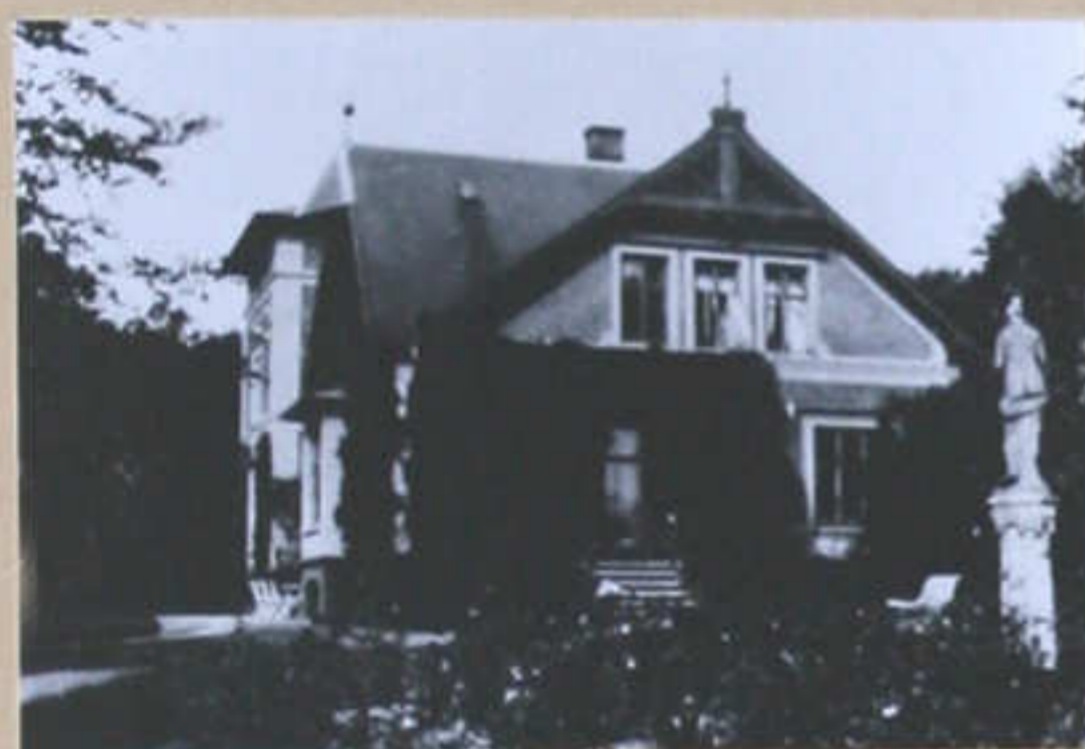
Solbakken set fra haven