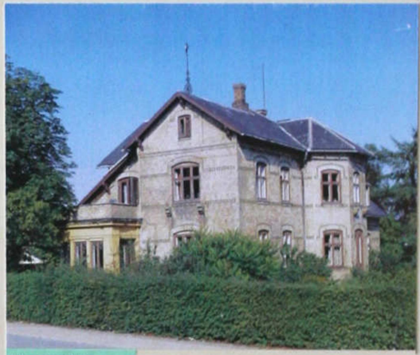
Hassersvej 112