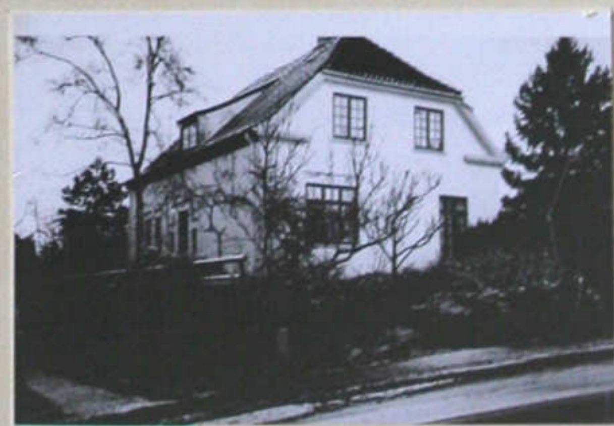
Kong Georgs Vej 5