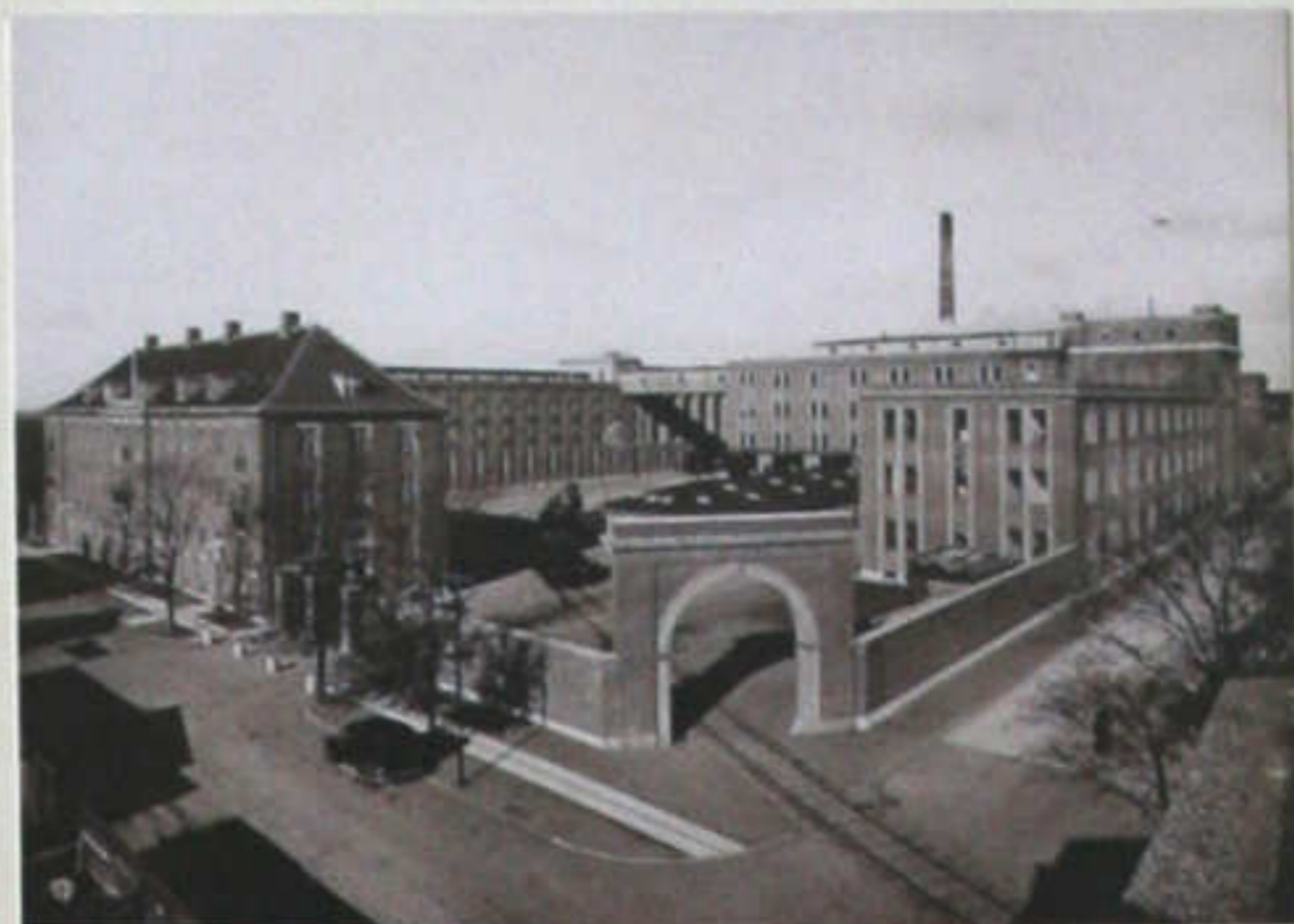
Den nye fabrik på Strandvejen. Indviet 1931