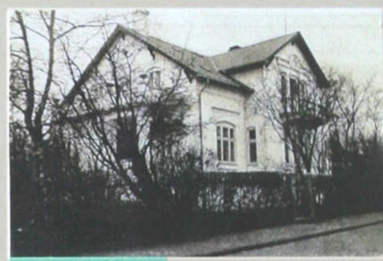
Villa "Pax"-Hassersvej 119