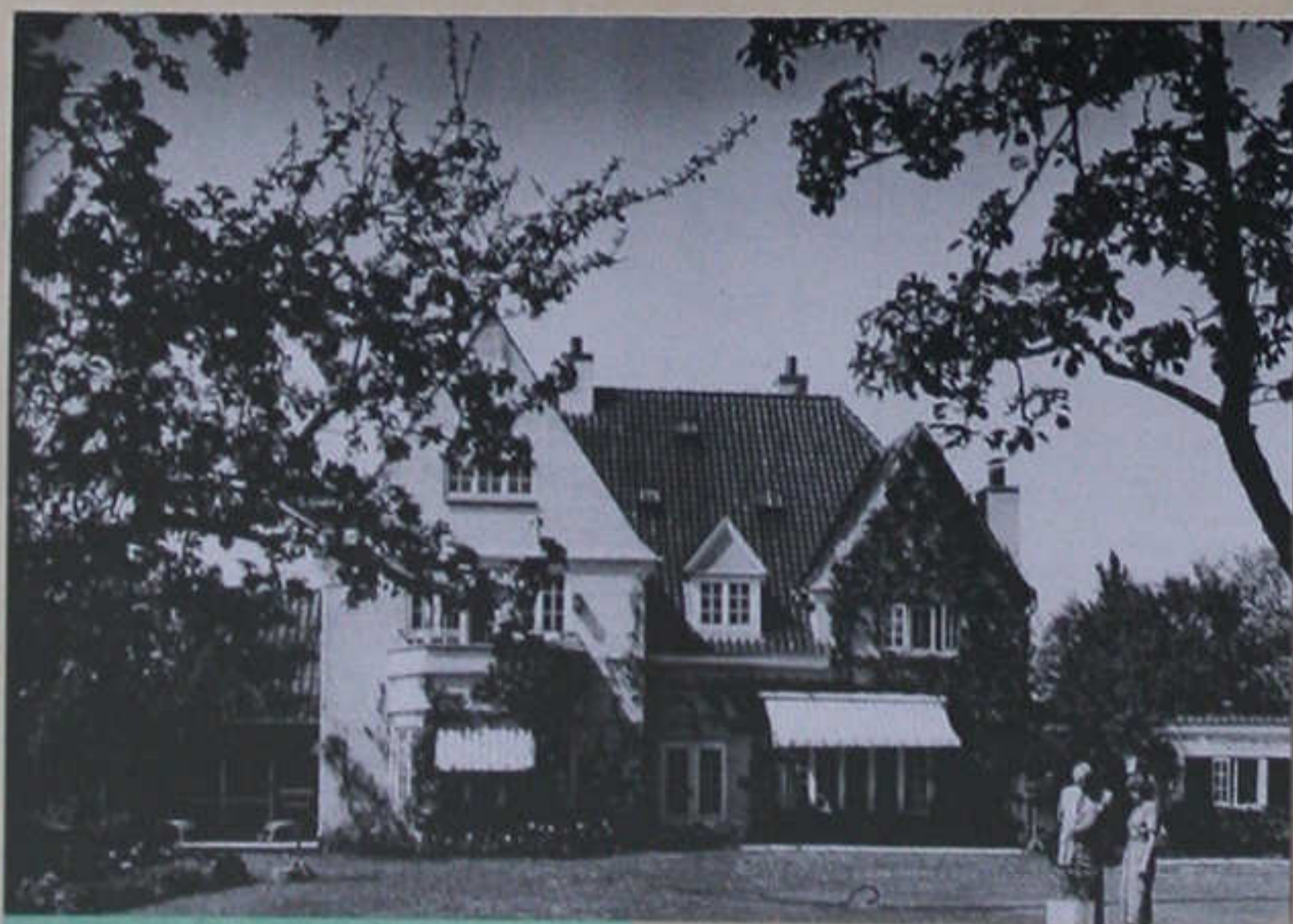
Hasserrisvej 159 - nedrevet 1988.