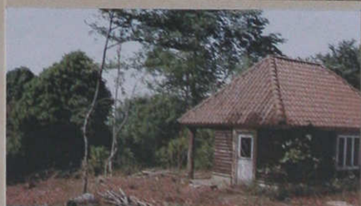
Lyshuset lå i den øverste del af Obels have. Blev nedrevet i slutningen af 1980'erne. Genopført i "KILDEPARKEN"