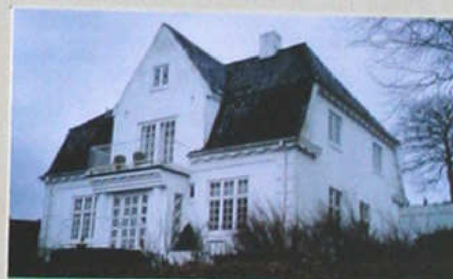
Hasserishøj 2 - opført i 1914.