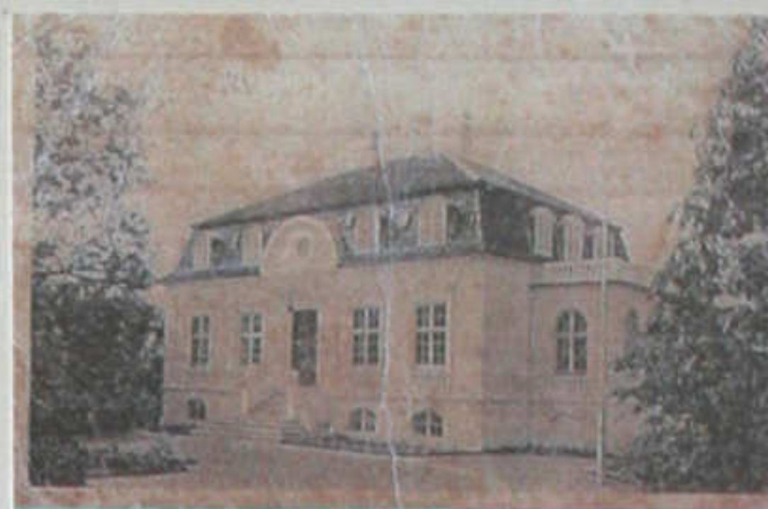
"Det hvide hus" - Hassersvej 134