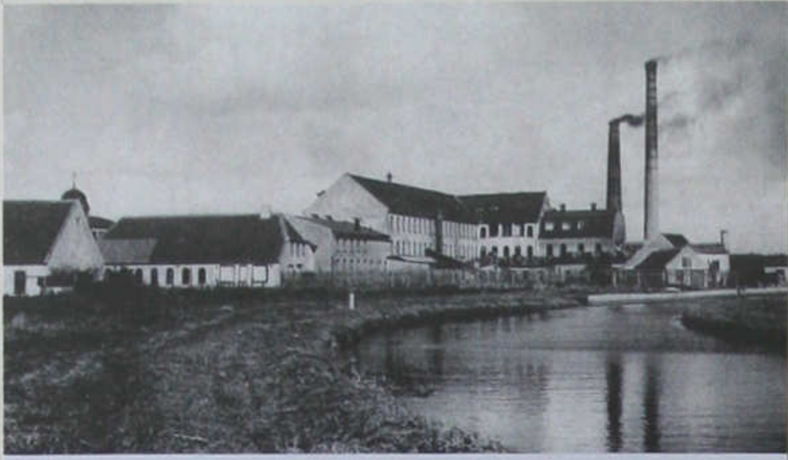
Kjær Mølle Fabrikker.