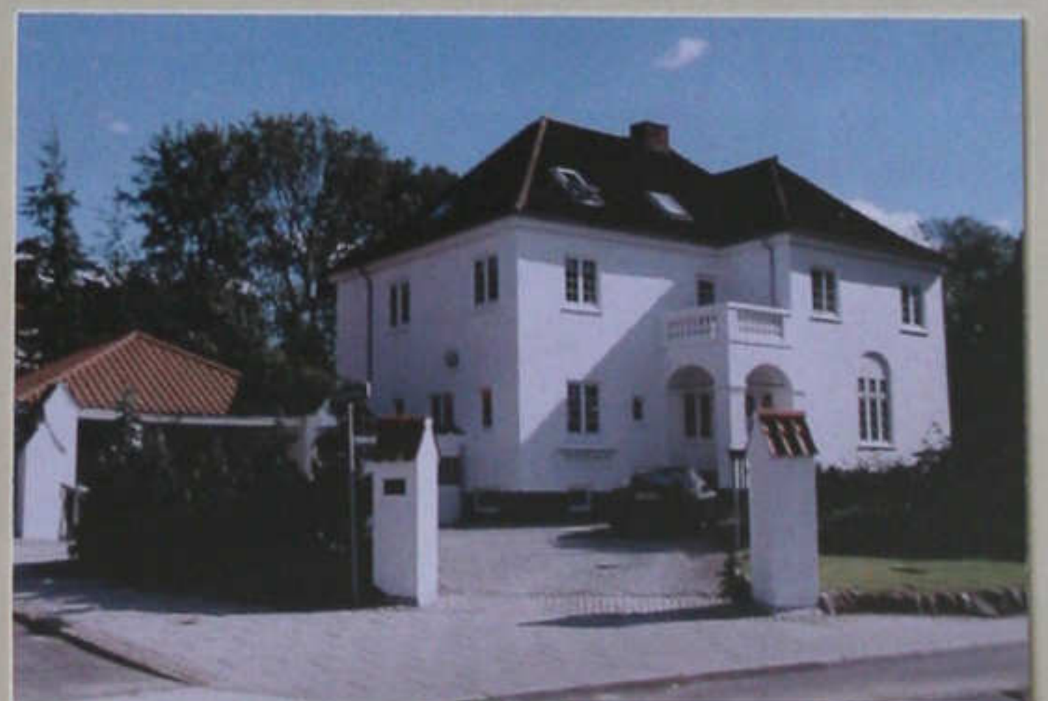
Villa "Kuben" Hasserisvej 143 - opført 1916.