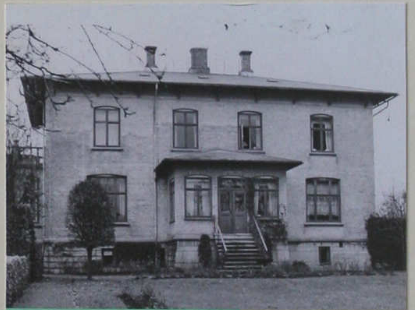
Villa Nova" Rafns Alle 1.