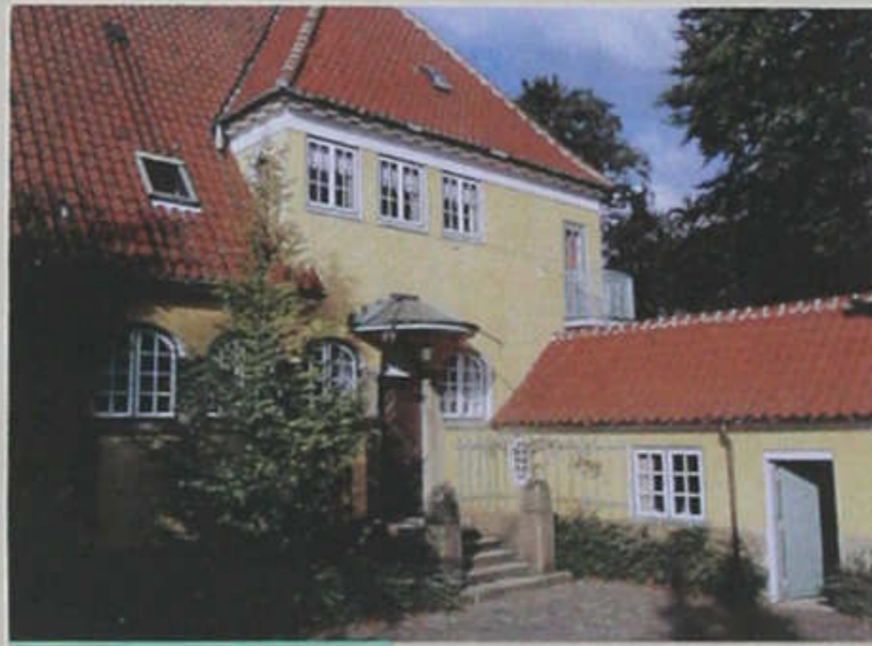
Hasserisvej 132.

C.V. Olsen bosatte sig ca. 1912 på Hasserisvej 132. Villaen var tegnet af arkitekt E. Packness, og hed på det tidspunkt "Vesterled".