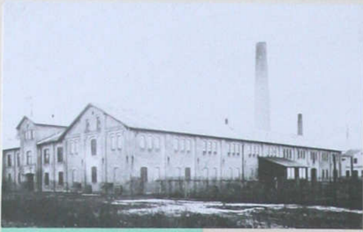
Halmvarefabrikken - Helgolandsgade 1