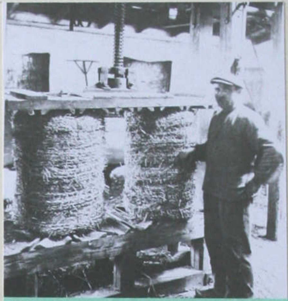
Aalborg Halmvarefabrik i 1917. - Halmbånd til brug ved jernstøbning.

Den havde til huse i lejede lokaler på grunden Helgolandsgade - Absalons-gade og Fredericiagade, hvor der tidligere var kemiske fabrikker. Bygningerne blev i 1925 overtaget af Aalborg kommune, der udlejede dem til kaserne. I 1938 blev de nedrevet.