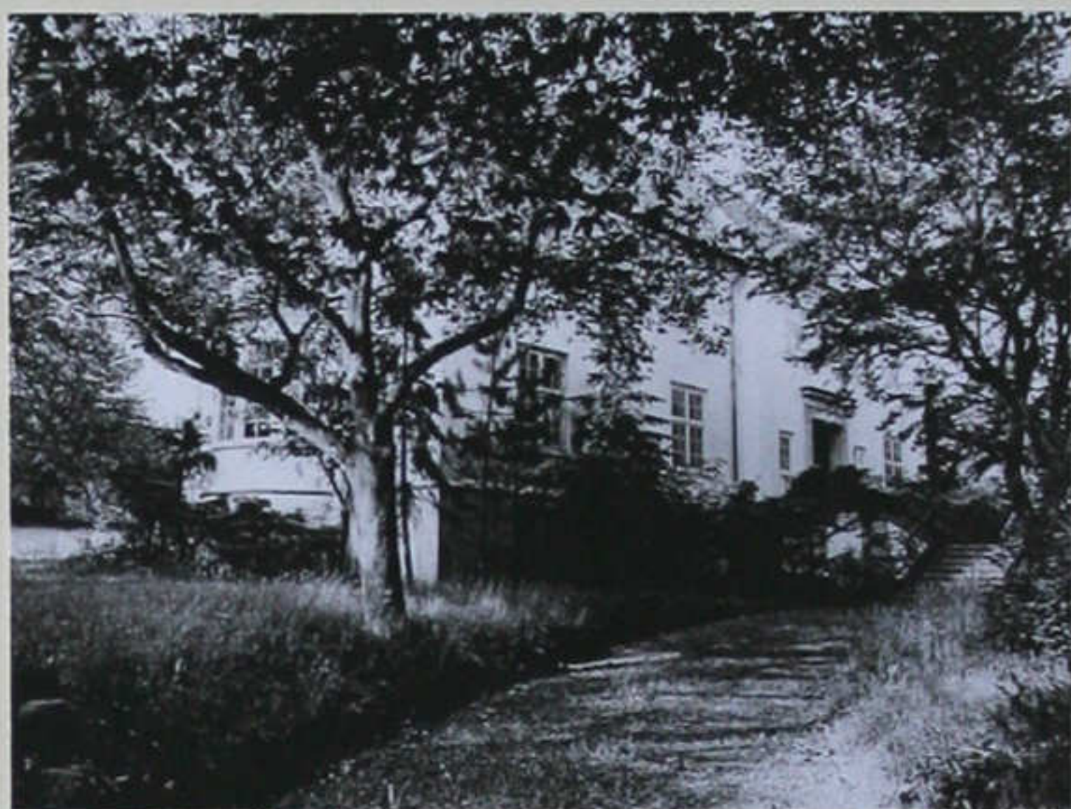
Villa "OPHAUG" - Hasserisvej 125