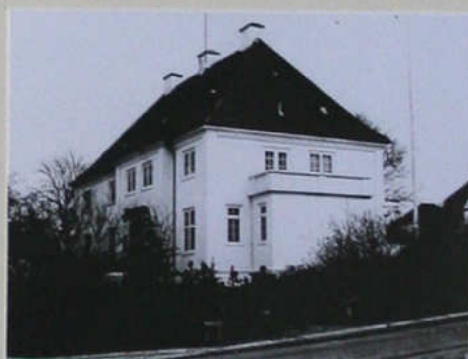
"OPHAUG" Hasserisvej 125 Nag. Aalborg Stadskontor