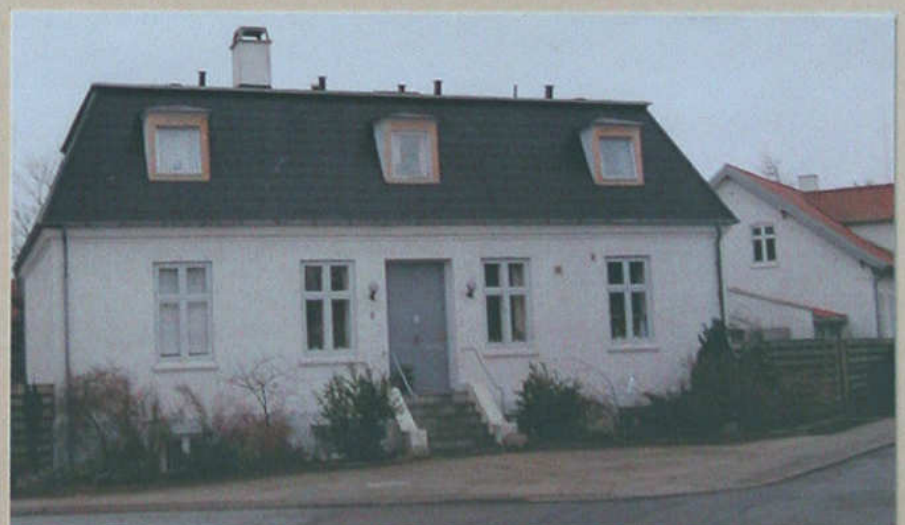
Villa "W" - Elme Alle nr. 6. Opført 1895