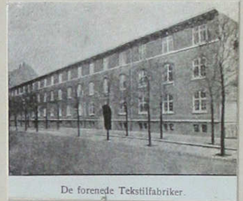
De forenede Tekstilfabrikker.