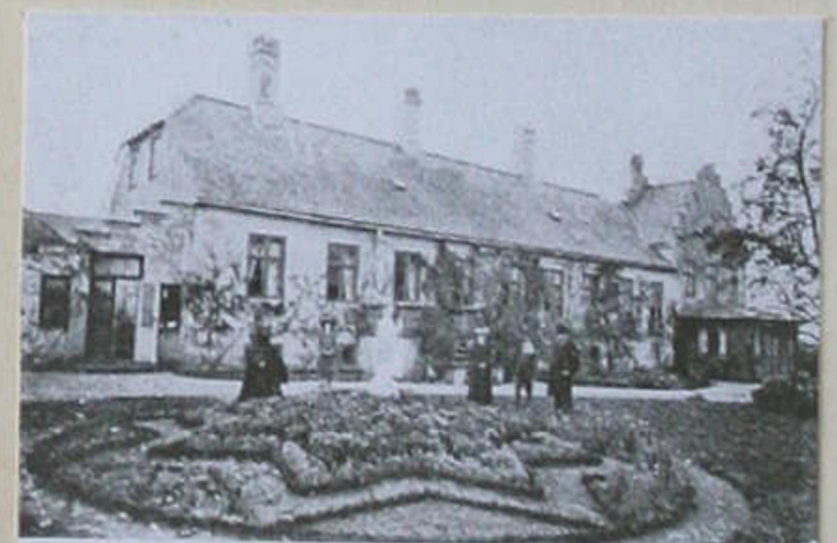
»Hasserisgaarden«.