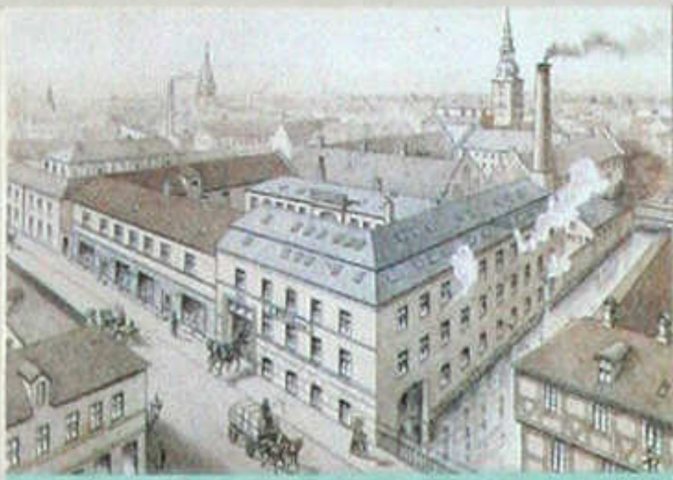
A.P. Wibroe's fabrikker i Bispensgade v/ Vesteraa i 1888

A.P. Wibroe's fabrikker og C. Langer's dampvæveri blev i 1897 sluttet sammen, omdannet til et A/S og fik navnet A/S De forenede Tekstilfabrikker, tidl. Langer og Wibroe. Der blev i 1897-1901 opført en ny stor fabrik på Kastetvej.