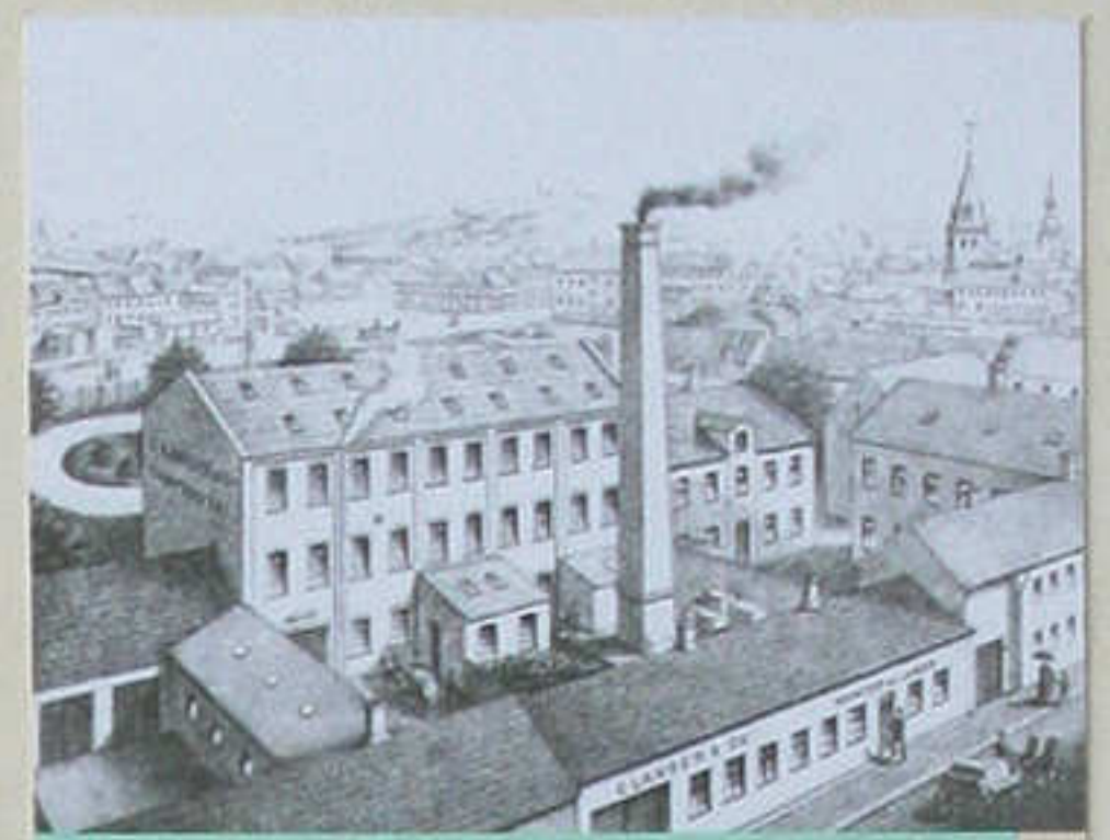
C.Langer's dampvæveri i Søndergade 24 - ca. 1890

A.P. Wibroe's fabrikker og C. Langer's dampvæveri blev i 1897 sluttet sammen, omdannet til et A/S og fik navnet A/S De forenede Tekstilfabrikker, tidl. Langer og Wibroe. Der blev i 1897-1901 opført en ny stor fabrik på Kastetvej.