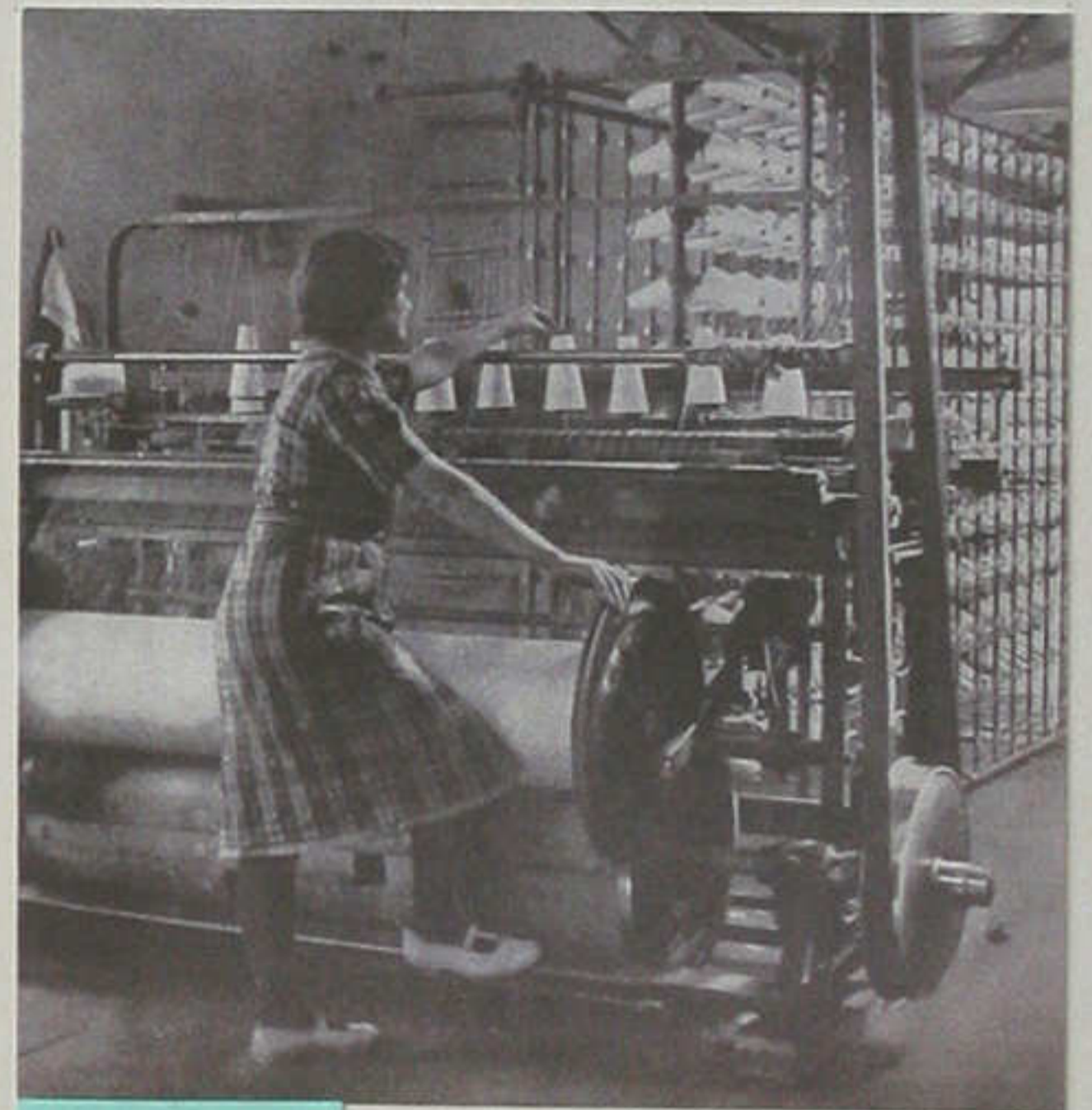
Interiør fra fabrikken