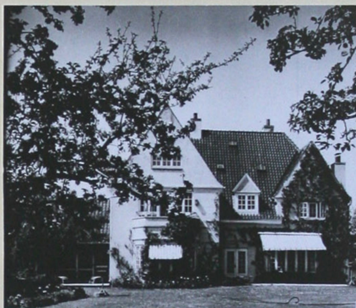
Boede Hasserisvej 159 villan nedrevet i 1988

var cand.polyt. Blev driftsbestyrer på cementfabrikken "DANMARK" i 1901 og direktør for samme fra 1913 til 1928. Var tillige direktør for cementfabrikken "RØRDAL" fra 1924 til 1936.