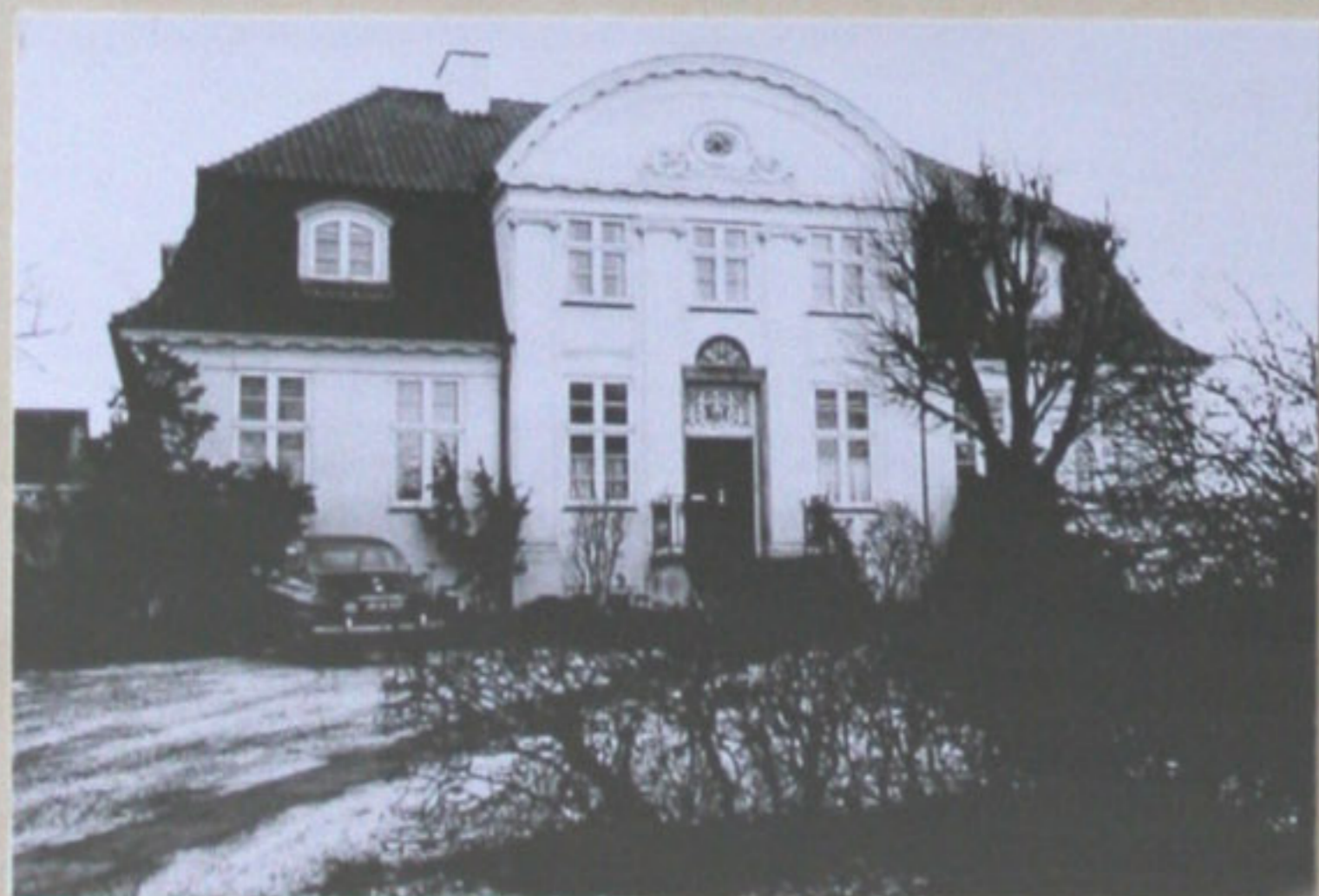
Boede i villa "TOFTE" Nordvestvej 26. Villan blev bygget i 1922.