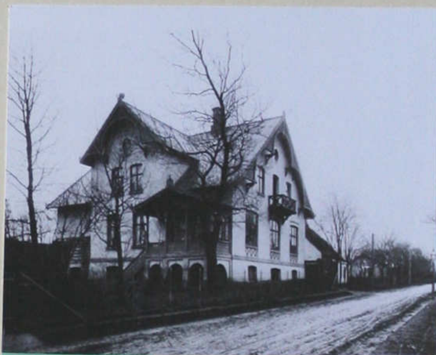
"Bakkely" -Hasserrisvej 105

Blev født i Aalborg 2. juli 1839, og døde samme sted 18. september 1908. Fik handelsbetjenteksamen i 1858. Grundlagde 9. juni 1863 Firma M.A. Schultz, bog- og papirhandel i Bispensgade 13. Overtog 1904 Sofus Asmussen's bogbinderi, og Adolph Holst's æskefabrik. De to firmaer blev slået sammen til Adolph Holst's Fabrikker.