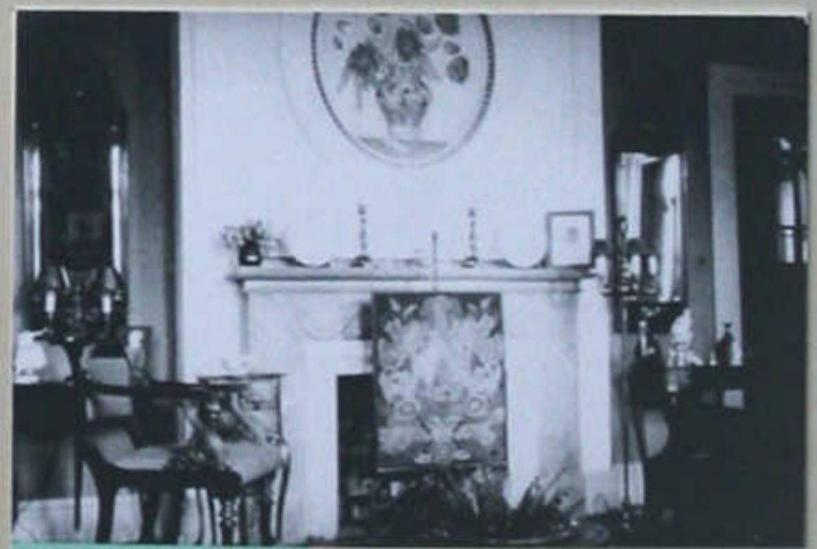
Interior fra "Graasten"