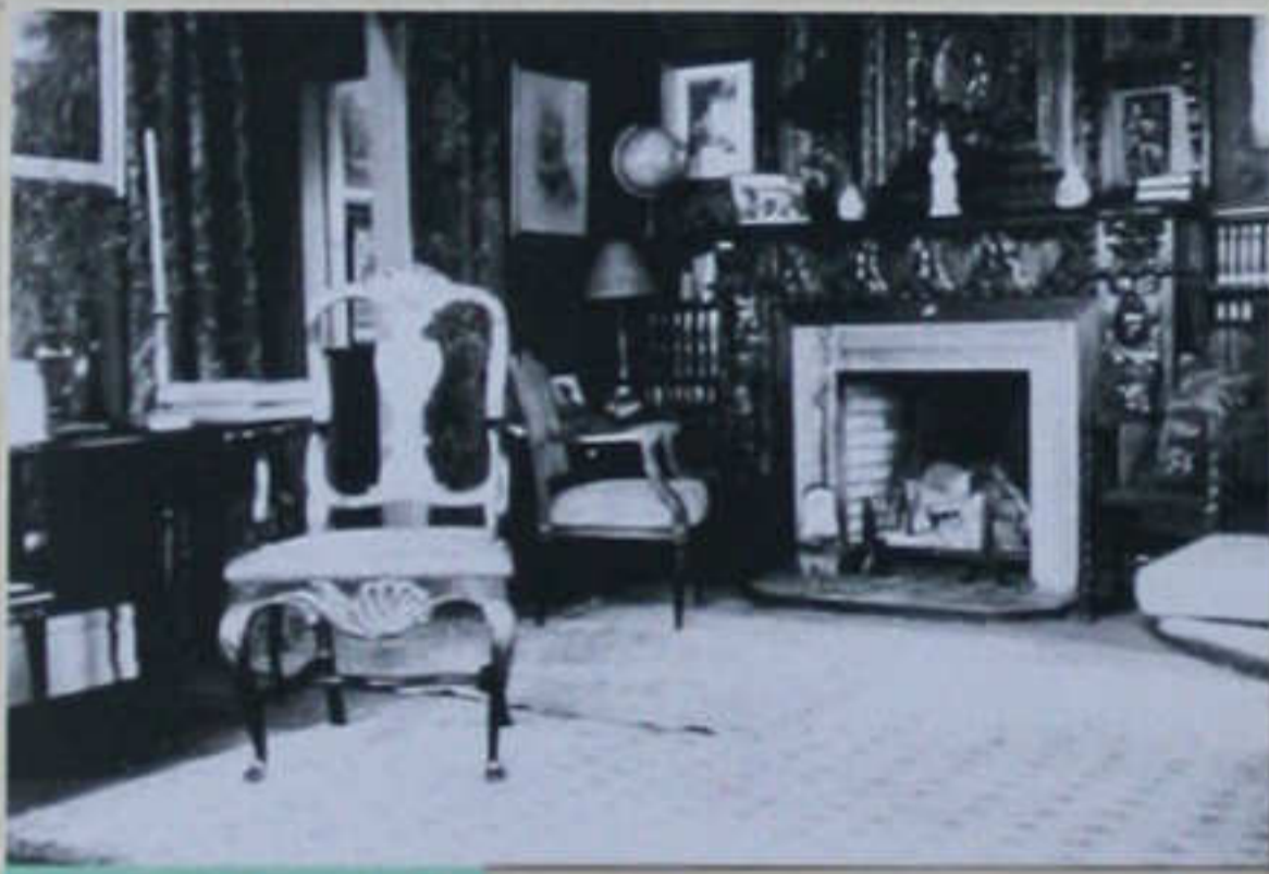
Interior fra "Graasten"