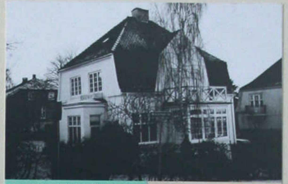
Villa "Nebo" - M.A. Schultzvej 8